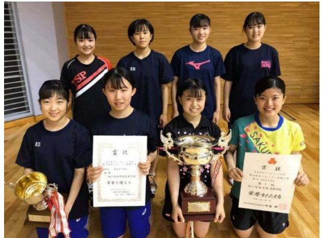
令和2年度女子団体優勝：福島県・桜の聖母学院高等学校