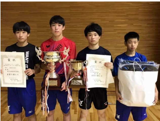
令和2年度男子団体優勝：福島県・帝京安積高等学校

〒023-0132 岩手県奥州市水沢羽田町うぐいす平72番地 TEL 0197-22-7000 FAX 0197-22-7001